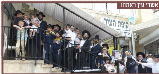
אשרי עין ראתהו

המדרגות העולות לביתו מלאות ילדים ואבותיהם בל"ג בעומר