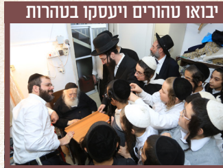
יבאו טהורים ויעסקו בטהרות