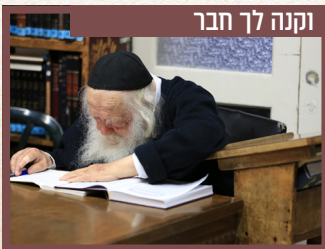
וקנה לך חבר

בכתבת חיבורו על ספר התהילים שיצא לאור לפני חודש ימים