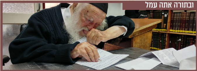
ובתורה אתה עמל