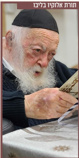
תורת אלוקיו בליבו