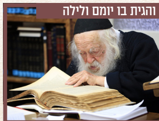
והגית בו יומם ולילה

בוחר בהנאה את ספר התורה הזעיר שהובא לביתו לקראת שמחת תורה