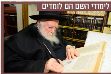
לימודי השם הם לומדים