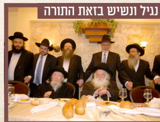
נגיל ונשיש בזאת התורה

עם מרן הגרמ"ל ליפוקביץ זצוק"ל בהכנסת ספר התורה שלו