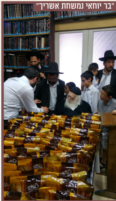
"בר יוחאי נמשחת אשריך"

בספירת העומר בל"ג בעומר מתוך לוח שיו"ל ע"י ארחות יושר