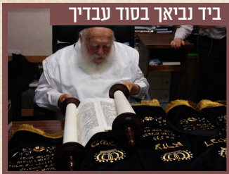
ביד נביאך בסוד עבדיך

מקבל בקורת רוח את ספרי הנביאים שהוכנסו לבית הכנסת שבביתו