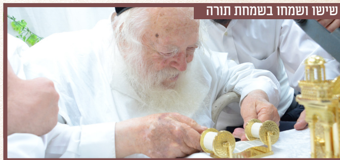
שישו ושמחו בשמחת תורה

כותב אות בספר תורה זעיר בעזרת משקפיים מיוחדים