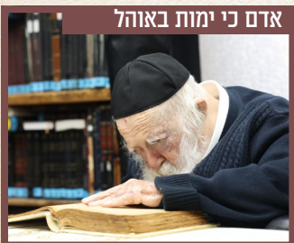
אדם כי ימות באוהל