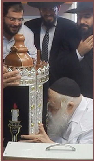
אם יתן איש את כל הון ביתו באהבה שאהב רבי חיים את התורה בוז יבוזו לו

חוסף עוד רגע של לימוד תורה בדרך לכינוס חשוב