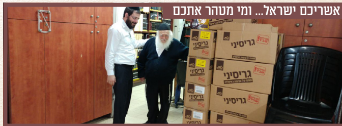
אשריכם ישראל... ומי מטהר אתכם

המדרגות העולות לביתו מלאות ילדים ואבותיהם בל"ג בעומר