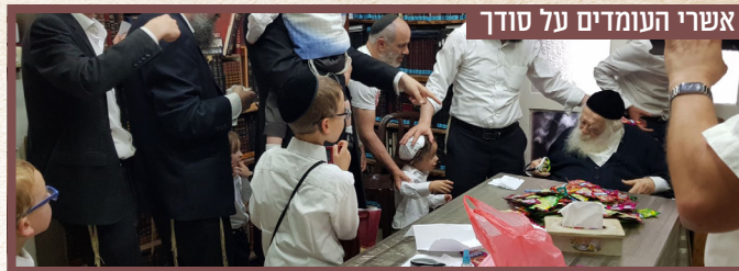
אשרי העומדים על סודך

בכתבת חיבורו על ספר התהילים שיצא לאור לפני חודש ימים