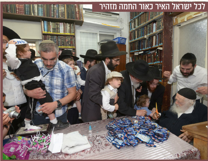
לכל ישראל האיר כאור החמה מזהיר