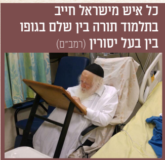
כל איש מישראל חייב בתלמוד תורה בין שלם בגופו בין בעל יסורין (רמב"ם)