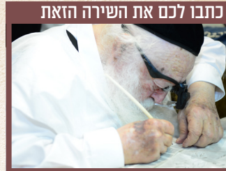
כתבו לכם את השירה הזאת

כותב אות בספר תורה זעיר בעזרת משקפיים מיוחדים