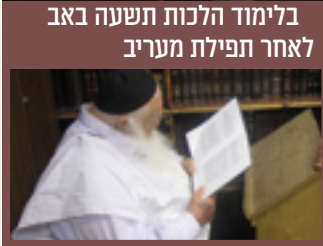
בלימוד הלכות תשעה באב לאחר תפילת מעריב