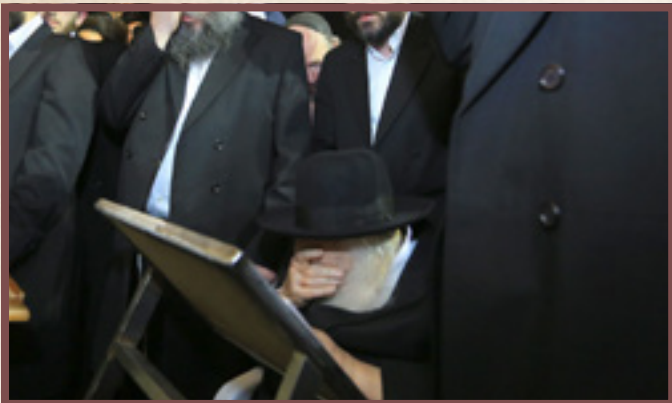
לאחר תפילת שחרית בכותל המערבי