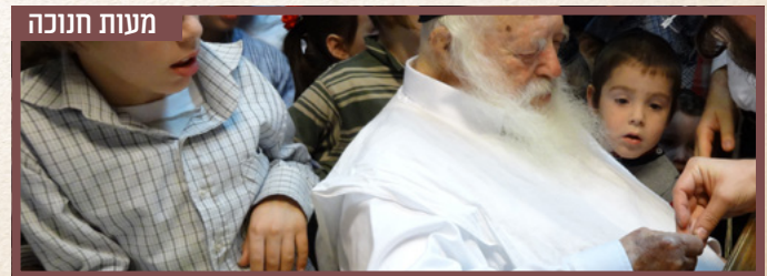
מעות חנוכה בחלוקת מעות חנוכה לצאצאיו בליל חמישי של חנוכה