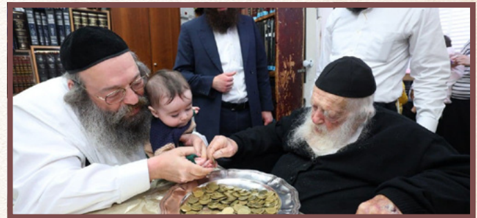
מעניק מעות חנוכה לצאצא רך בשנים