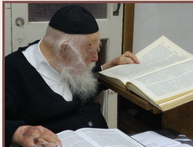
בלימוד מעמיק בספר חזון איש