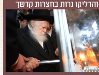
והדליקו נרות בחצרות קדשך