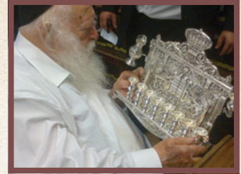
משיב על שאלה בעניני נרות חנוכה