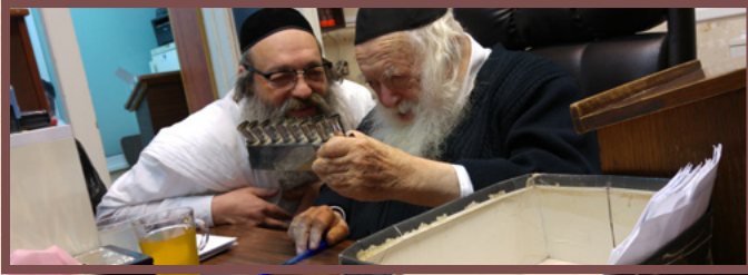
מחזיק בידיו ובוחן את המנורה של אביו זצ"ל