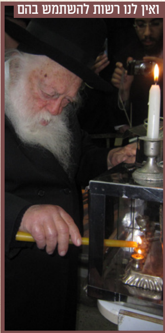
ואין לנו רשות להשתמש בהם עם נר ה"שמש" ממנו הדליק את הנרות