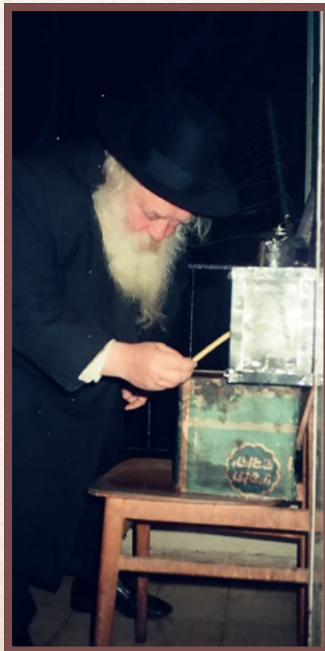
בהדלקת נרות חנוכה לפני עשרות שנים