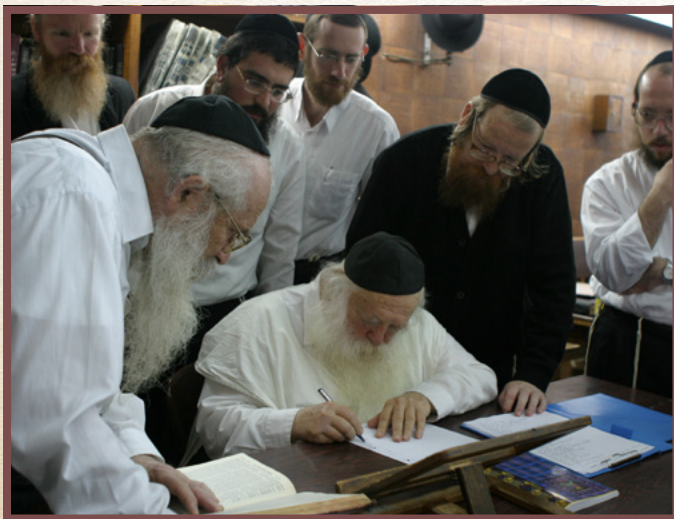
בחלוקת הש"ס ביארצייט של החזון איש בכולל חזון איש