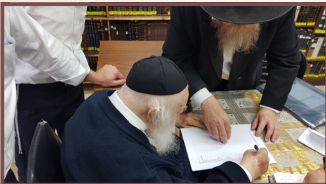
תשפ"א - מקבל על עצמו ללמוד מסכת לעילוי נשמת החזון איש