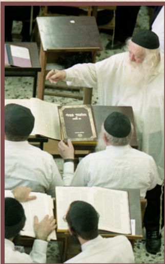
מחלק בין האברכים בכולל חזו"א את לימוד הש"ס לעילוי נשמת החזו"א