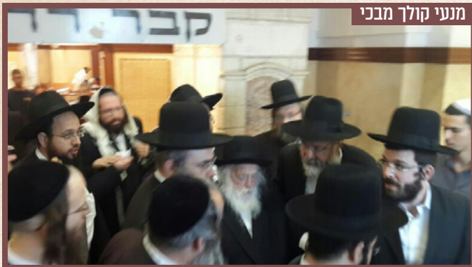
מנעי קולך מבני