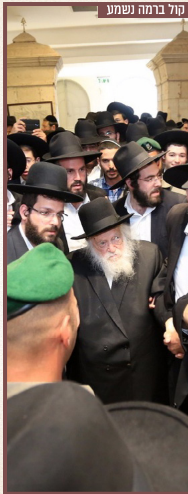
קול ברמה נשמע