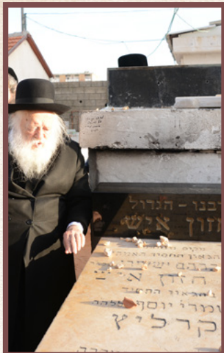
בצינן החזון איש זללה"ה